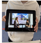
Ernährung und Hygiene - Stufe 6

Gesunde Ernährung, Wohlfühlen und Nachhaltigkeit – unsere Fünft- und Sechstklässler zeigen, wie spannend Lernen außerhalb des Klassenzimmers sein kann.